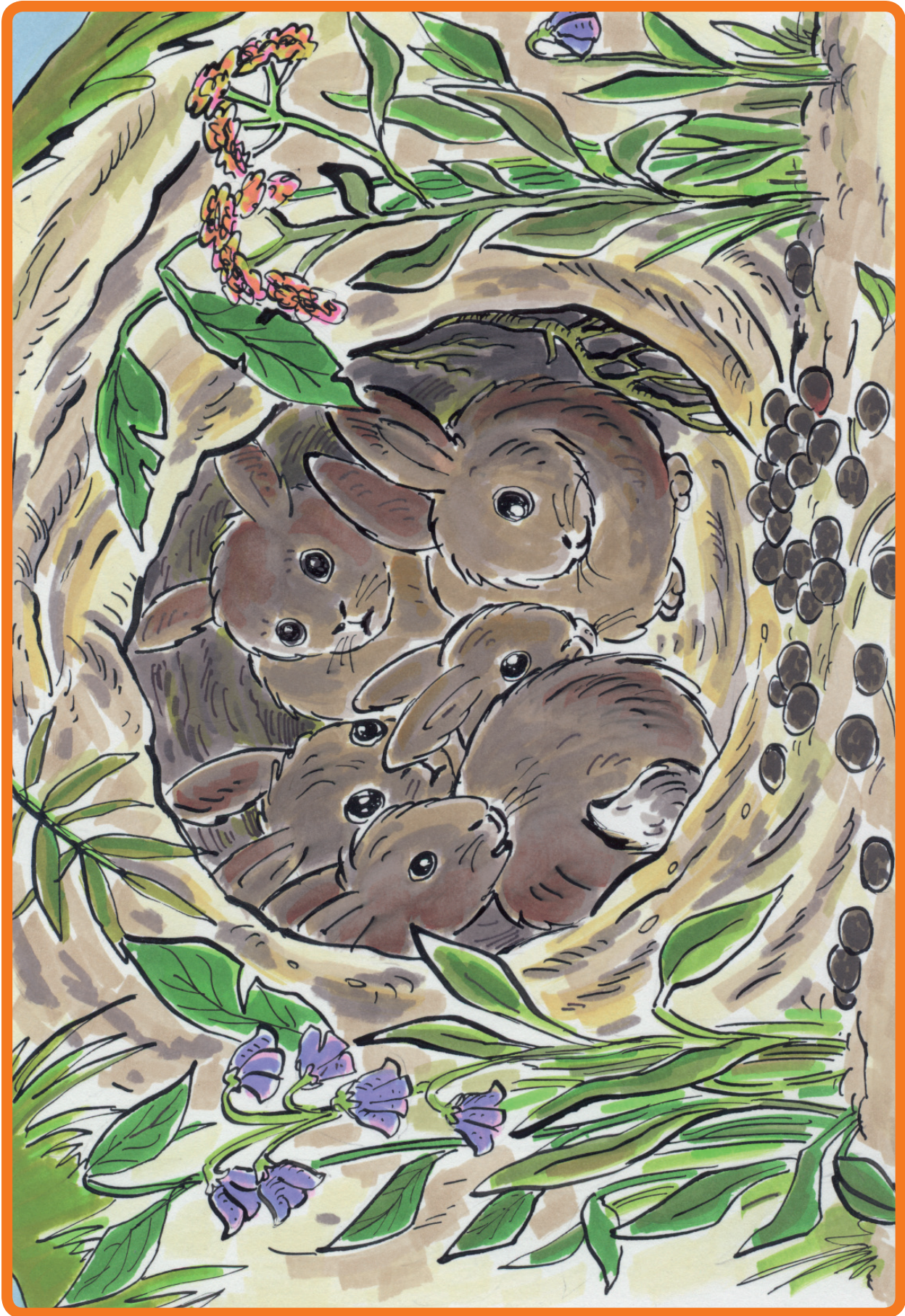
6. Praatplaat Konijn Witoor is haar holletje kwijt