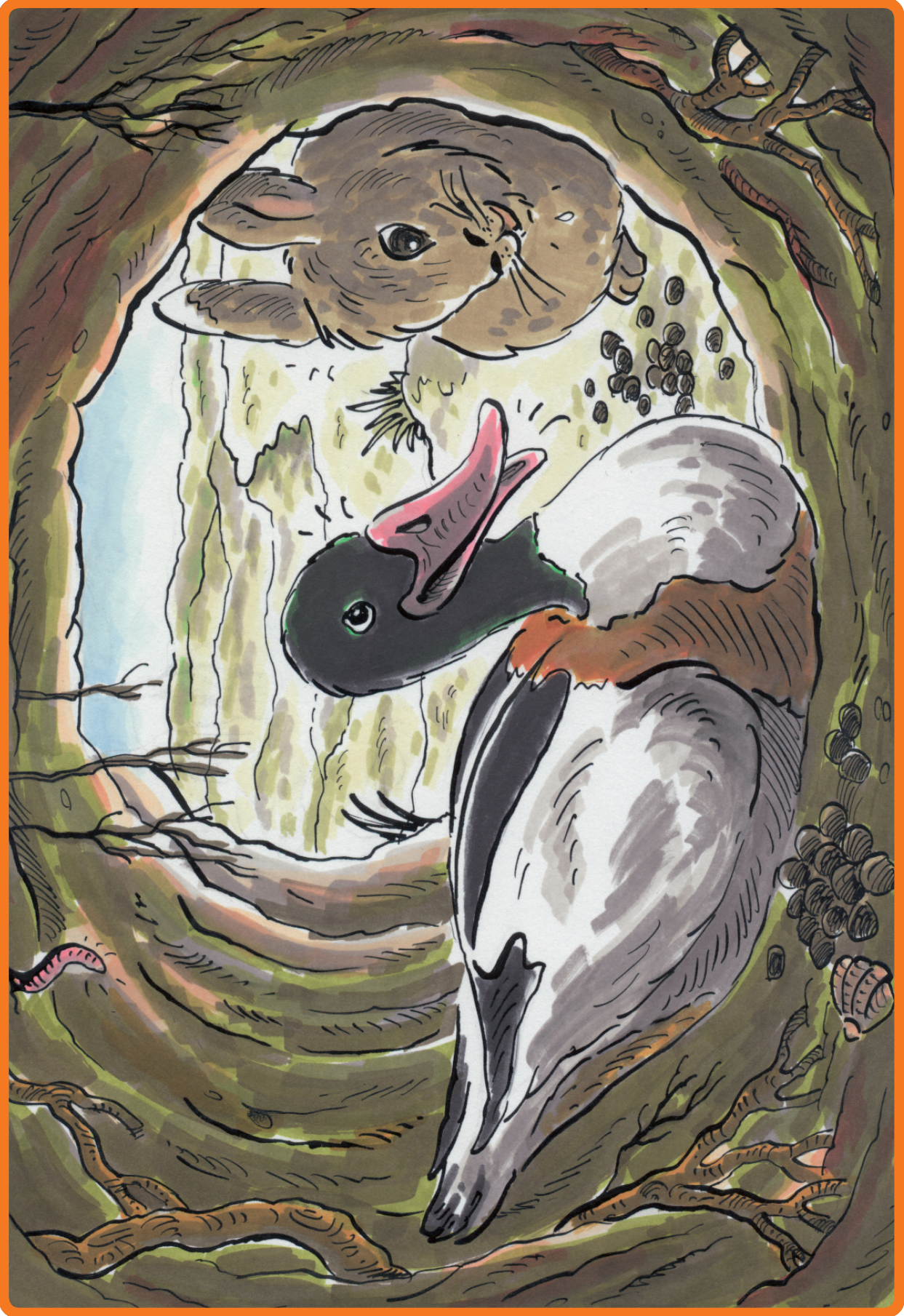
6. Praatplaat Konijn Witoor is haar holletje kwijt