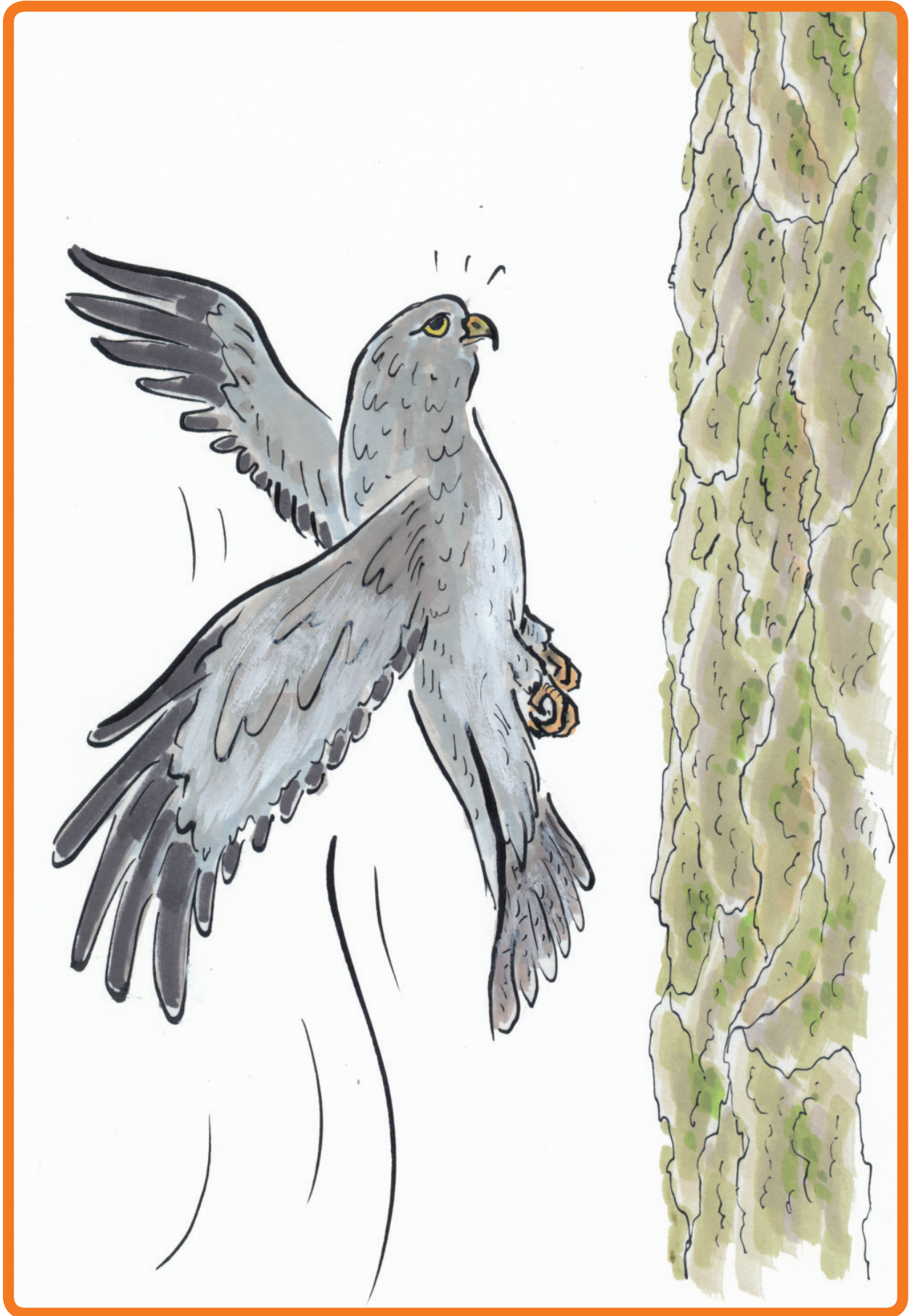
6. Praatplaat Konijn Witoor is haar holletje kwijt