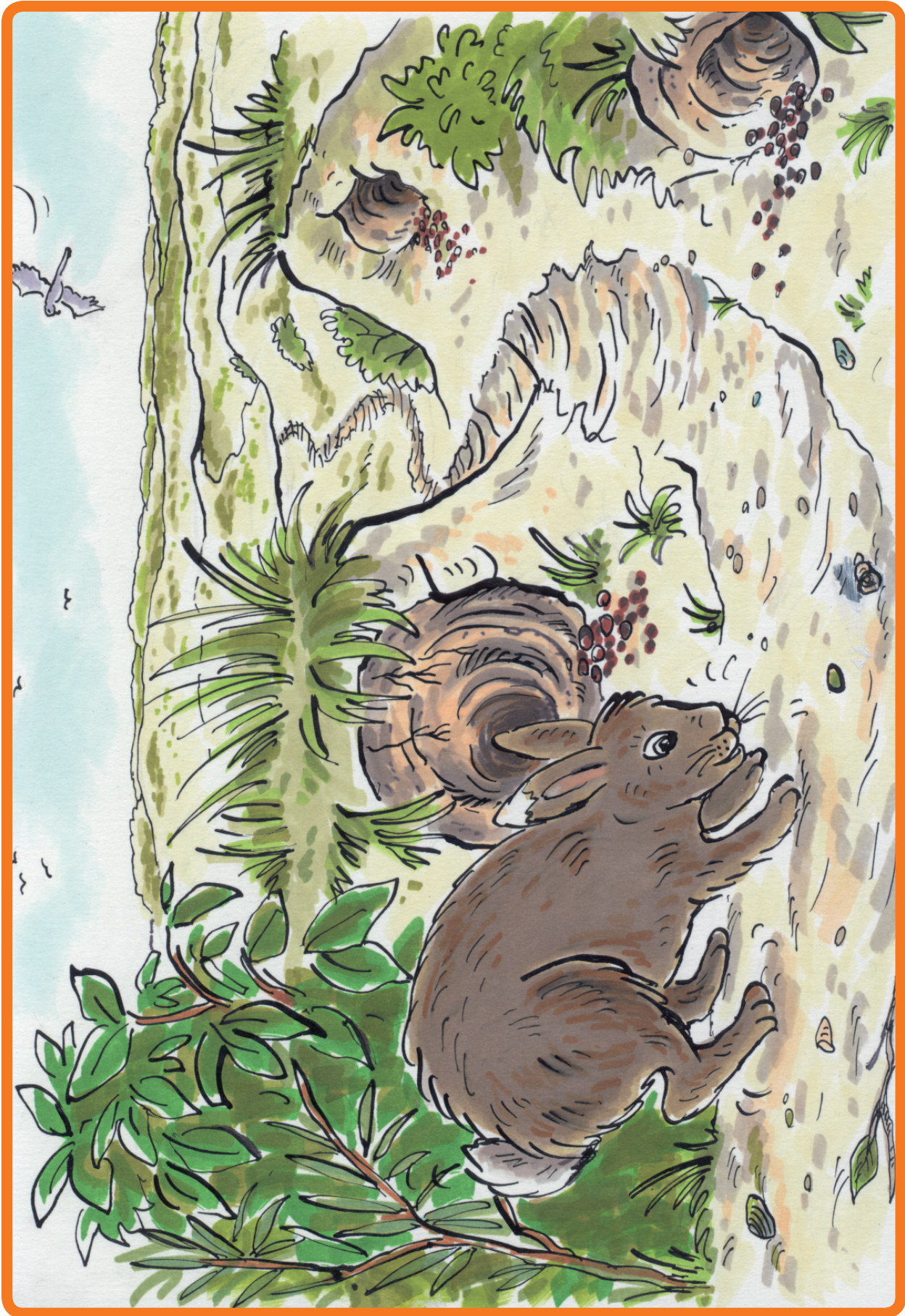
6. Praatplaat Konijn Witoor is haar holletje kwijt